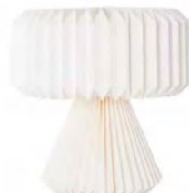
LAGERHAUS Honey comb