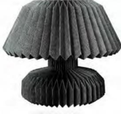
BY ON Hensi table lamp