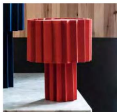
FOLKFORM Plissé table lamp